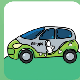
Biogàs a partir d'aigües i llots