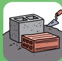
Materials de construcció