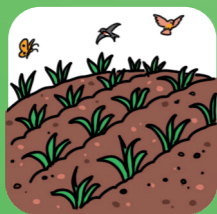
Abonaments per a l'agricultura