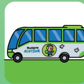
Biometà a partir de residus